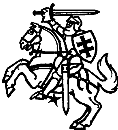
V. Lietuvos valstybės herbo adaptacija be skydo