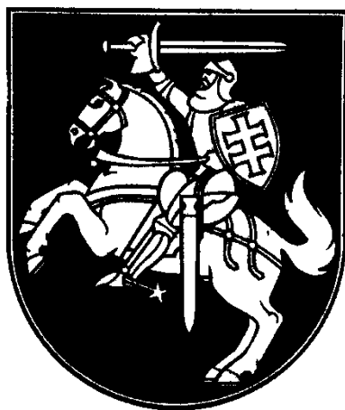
III. Lietuvos valstybės herbo adaptacija Spausdinti raudona spalva