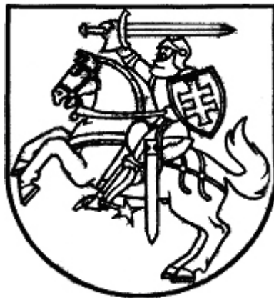
I. Lietuvos valstybės herbo adaptacija – kontūras Spalvinti pagal etaloną