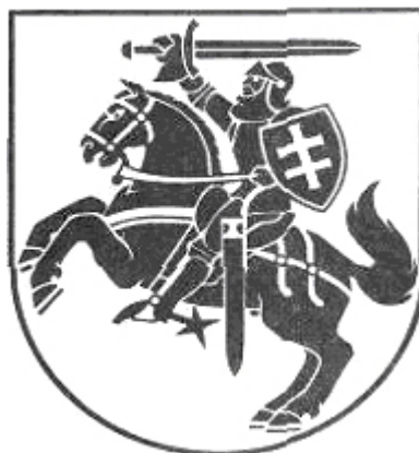
II. Lietuvos valstybės herbo adaptacija Spausdinti šviesia spalva tamsiame fone