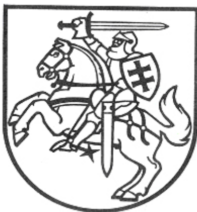
IV. Lietuvos valstybės herbo adaptacija Valstybės įstaigų blankams ir leidimams