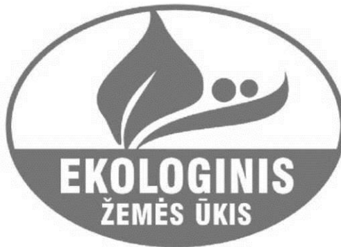
1 pav. Spalvotas ekologiškų produktų ženklas

9. Spalvotas ekologiškų produktų ženklas (žr. 1 pav.):