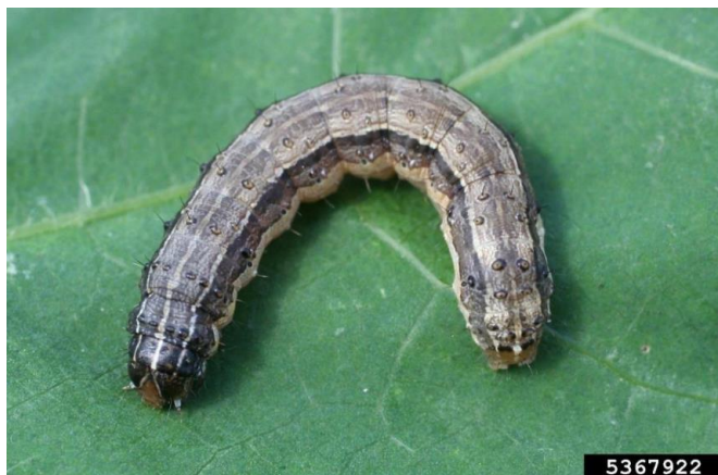
3 pav. Subrendusi Spodoptera frugiperda lerva.