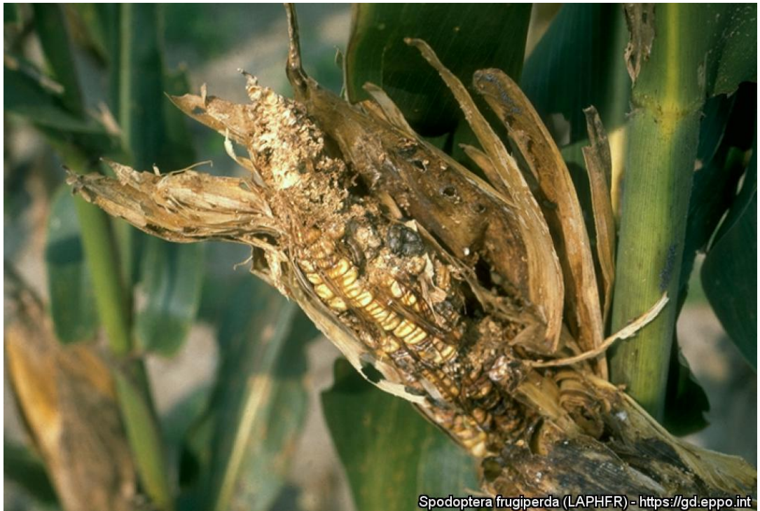
7 pav. Spodoptera frugiperda lervų ekskrementai ant kukurūzo lapo.

Spodoptera frugiperda (LAPHFR) - https://gd.eppo.int