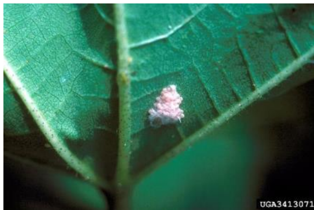
2 pav. Spodoptera frugiperda kiaušinėlių santalka.