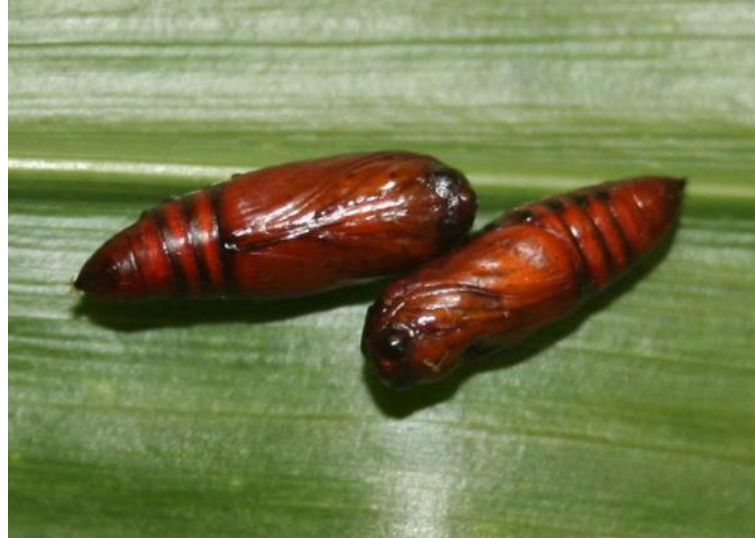
4 pav. Spodoptera frugiperda lėliukės. Nuotraukos šaltinis: https://efsa.onlinelibrary.wiley.com/doi/epdf/10.2903/sp.efsa.2020.EN-1895

https://efsa.onlinelibrary.wiley.com/doi/epdf/10.2903/sp.efsa.2020.EN-1895