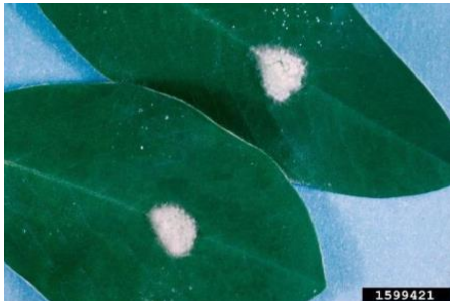
10 pav. Spodoptera frugiperda kiaušinėlių santalkos.