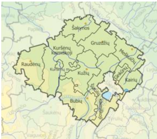
Šiaulių rajono savivaldybės seniūnijos

Šiaulių rajono savivaldybės plotas – 1 807 km 2 , ir jie sudaro 2,77 proc. Lietuvos teritorijos. Rajono teritorija yra suskirstyta į 11 seniūnijų: Bubių, Ginkūnų, Gruzdžių, Kairių, Kuršėnų kaimiškąją, Kuršėnų miesto, Kužių, Meškuičių, Raudėnų, Šakynos, Šiaulių kaimiškąją.