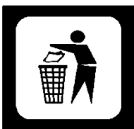
Komunalinių atliekų konteineris arba dėžė