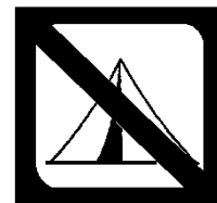
Rengti stovyklavietes draudžiama