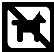
Vesti naminius gyvūnus draudžiama